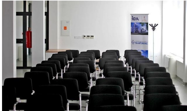
Konferencijska dvorana Poduzetničkog inkubatora i akceleratora Antunovac

jedinica infrastrukture; poslovna zgrada sastoji se od 34 uredska prostora, 2 proizvodna prostora, 1 open space prostora, sanitarija, kuhinja, hardverske i softverske sobe, multifunkcionalne dvorane i konferencijske sale.