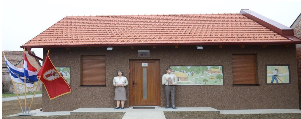
Kulturno-informativno turistički centar Žnidarec

U multimedijalnom izložbenom prostoru Centra posjetitelji mogu razgledati stalni izložbeni postav djela Vjekoslava Žnidareca, ali i saznati nešto više o ostalim sadržajima i atrakcijama smještenima u blizini, poput srednjovjekovne utvrde Kolođvar ili rute Stepski sokol. Za upoznavanje kompletnog sadržaja Centra prilikom samog dolaska potrebno je preuzeti mobilnu aplikaciju RODA – Centar Žnidarec, putem koje se posjetitelju preko QR kodova otvaraju dodatne informacije o povijesti naselja, života umjetnika kao i povijesnog naslijeđa ovoga kraja.