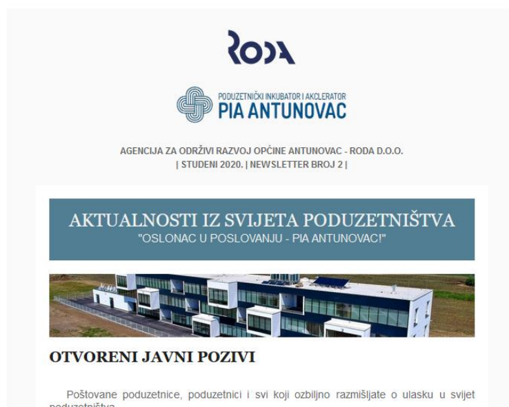
Newsletter s novostima iz svijeta poduzetništva

Također je pokrenut i Newsletter s novostima iz svijeta poduzetništva, aktualnim natjecajima i zanimljivostima, a koji će se redovno slati i u 2022. godini, minimalno 1 puta mjesečno.