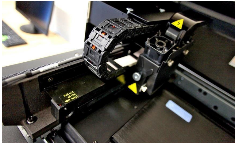
Stratasys Objet 30 pro 3D Printer; jedan od tri 3D printera na raspolaganju poduzetnicima u Poduzetničkom inkubatoru i akceleratoru Antunovac

Izgradnja nove poduzetničke infrastrukture ubrzava stvaranje inovacija, poboljšava umrežavanje PPI-jeva koji pružaju različite usluge te unaprjeđuje kvalitetu poslovanja, modernizira i razvija industrijsku bazu šireg područja.