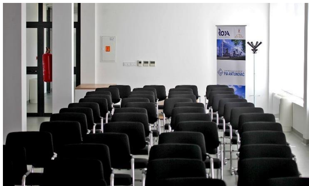
Konferencijska dvorana Poduzetničkog inkubatora i akceleratora Antunovac

Izgradnjom Poduzetničkog inkubatora i akceleratora Antunovac razvila se profesionalna i visokotehnoški opremljena poslovna infrastruktura koja osigurava usluge za MSP-ove koji ulaze u poduzetničku aktivnost i one koji žele razvijati inovativni poslovni pothvat. Projektno rješenje dizajnirano je u svrhe jačanja poduzetničkog okruženja u Općini Antunovac sa širim područjem te jačanja regionalne konkurentnosti kroz poboljšanje dostupnosti poduzetničko poslovne infrastrukture MSP-ovima. Izgrađeni objekt obuhvaća 40 funkcionalno-prostornih jedinica infrastrukture; poslovna zgrada sastoji se od 34 uredska prostora, 2 proizvodna prostora, 1 open space prostora, sanitarija, kuhinja, hardverske i softverske sobe, multifunkcionalne dvorane i konferencijske sale.