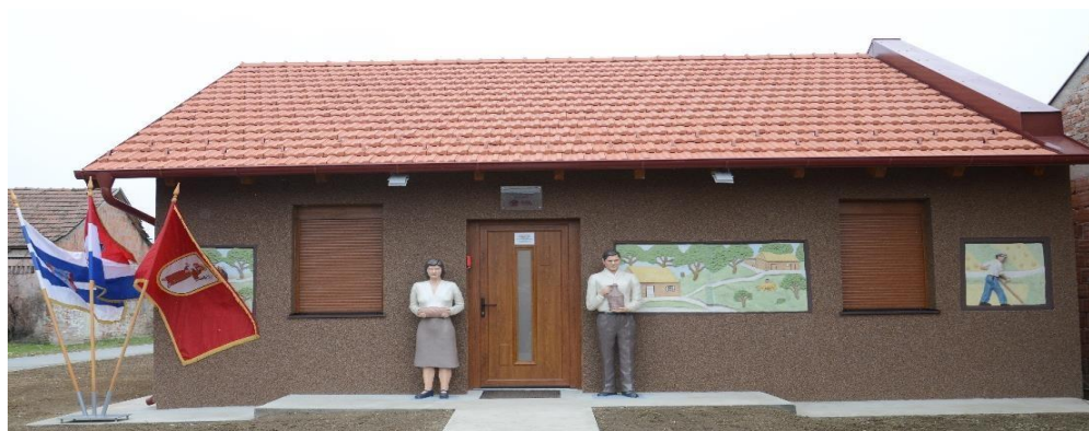
Kulturno-informativno turistički centar Žnidarec

U sklopu svoga redovnoga poslovanja, Agencija RODA d.o.o. provodi aktivnost vođenja Kulturno-informativno turističkog centra Žnidarec (KITC Žnidarec) u Ivanovcu koji je službeno otvoren u prosincu 2018. godine. Projekt rekonstrukcije i prenamjene postojeće kuće kipara naive Vjekoslava Žnidareca (1931.-2000.) u KITC Žnidarec sufinanciran je sredstvima Ministarstva turizma i Općine Antunovac, a njegovom realizacijom nastao je novi sadržaj vezan uz kulturno-povijesno nasljeđe ovoga kraja. Nositelj projekta vrijednog 731.762,04 kuna je Općina Antunovac, a projektnu prijavu za natječaj pripremila je Agencija za održivi razvoj Općine Antunovac – RODA d.o.o. za gospodarski i ruralni razvoj i poticanje poduzetništva, koja je bila angažirana i za provedbu projekta.