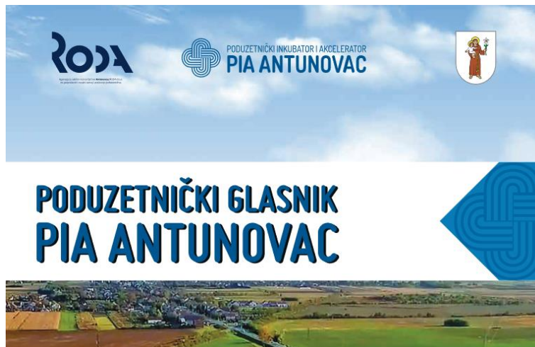
Poduzetnički glasnik u svrhu promocije poduzetništva

Također je pokrenut i Newsletter s novostima iz svijeta poduzetništva, aktualnim natjecajima i zanimljivostima, a koji će se redovno slati i u 2022. godini, minimalno 1 puta mjesečno.