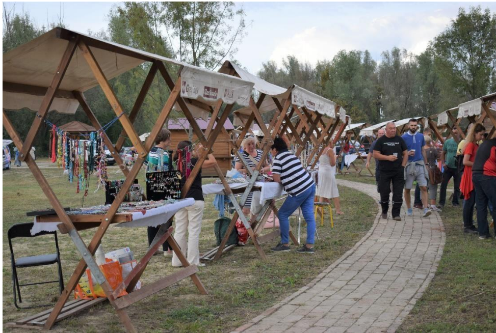
Gospodarski sajam Kolođvar

Općenito, stvoreni su preduvjeti za uspješno odvijanje sajma što uključuje pozive izlagačima, nabavu sajamske opreme - najam šatora, sklopivih drvenih štandova, razglasa, promociju putem letaka, pozivnica, jumbo plakata na frekventnim pozicijama, te najave putem javnih medija od tiskanih medija, lokalne i nacionalne televizija do društvenih mreža i internet portala. Na gospodarskom sajmu sudjeluje dvadesetak izlagača, obrtnika i obiteljskih - poljoprivrednih gospodarstva sa područja Općine Antunovac, Općine Čepin te ostalih područja Osječko-baranjske županije. Kroz sajam izlagači mogu razmijeniti svoja iskustva, uspostaviti nove kontakte i međusobno se povezati kako bi ojačali svoju poziciju na tržištu.