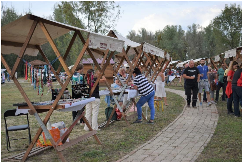
Gospodarski sajam Kolođvar

Općenito, stvoreni su preduvjeti za uspješno odvijanje sajma što uključuje pozive izlagačima, nabavu sajamske opreme - najam šatora, sklopivih drvenih štandova, razglasa, promociju putem letaka, pozivnica, jumbo plakata na frekventnim pozicijama, te najave putem javnih medija od tiskanih medija, lokalne i nacionalne televizija do društvenih mreža i internet portala. Na gospodarskom sajmu sudjeluje dvadesetak izlagača, obrtnika i obiteljskih - poljoprivrednih gospodarstva sa područja Općine Antunovac, Općine Čepin te ostalih područja Osječko-baranjske županije. Kroz sajam izlagači mogu razmijeniti svoja iskustva, uspostaviti nove kontakte i međusobno se povezati kako bi ojačali svoju poziciju na tržištu.