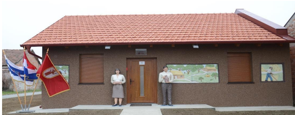
Kulturno-informativno turistički centar Źnidarec

U sklopu svoga redovnoga poslovanja, Agencija RODA d.o.o. provodi aktivnost vođenja Kulturno-informativno turističkog centra Źnidarec (KITC Źnidarec) u Ivanovcu koji je službeno otvoren u prosincu 2018. godine. Projekt rekonstrukcije i prenamjene postojeće kuće kipara naive Vjekoslava Źnidareca (1931.-2000.) u KITC Źnidarec sufinanciran je sredstvima Ministarstva turizma i Općine Antunovac, a njegovom realizacijom nastao je novi sadržaj vezan uz kulturno-povijesno nasljeđe ovoga kraja. Nositelj projekta vrijednog 731.762,04 kuna je Općina Antunovac, a projektnu prijavu za natječaj pripremila je Agencija za održivi razvoj Općine Antunovac – RODA d.o.o. za gospodarski i ruralni razvoj i poticanje poduzetništva, koja je bila angažirana i za provedbu projekta.