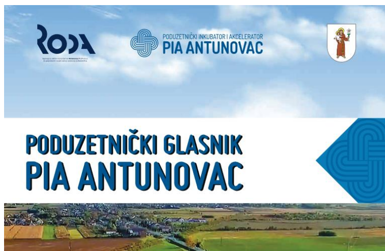
Poduzetnički glasnik u svrhu promocije poduzetništva

Također je pokrenut i Newsletter s novostima iz svijeta poduzetništva, aktualnim natjecajima i zanimljivostima, a koji će se redovno slati i u 2021. godini, minimalno 1 puta mjesečno.