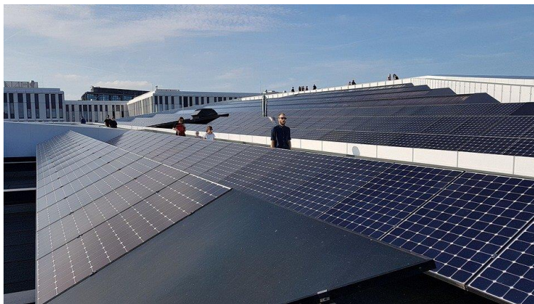
Solarni paneli

Projekt je prijavljen na Javni natječaj za dodjelu tržišne premije i zajamčene otkupne cijene za poticanje proizvodnje električne energije iz obnovljivih izvora energije 1/2020, a koji je raspisao Hrvatski operator tržišta energije d.o.o. (HROTE) u studenome 2020. godine.