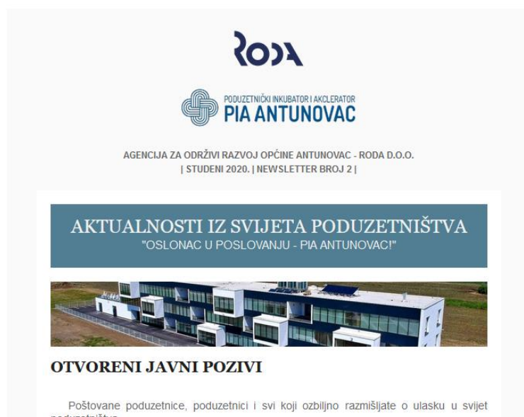
Newsletter s novostima iz svijeta poduzetništva

Također je pokrenut i Newsletter s novostima iz svijeta poduzetništva, aktualnim natjecajima i zanimljivostima, a koji će se redovno slati i u 2021. godini, minimalno 1 puta mjesečno.