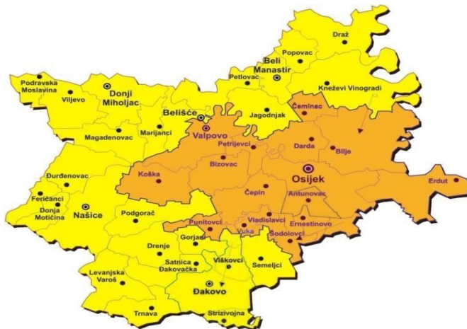
Područje Urbane aglomeracije Osijek

Interesantno je napomenuti da se Urbanoj aglomeraciji Osijek kojoj pripadaju općine i gradovi Osječko-baranjske županije priključila općina Tordinci koja teritorijalnim ustrojem pripada Vukovarsko-srijemskoj županiji.