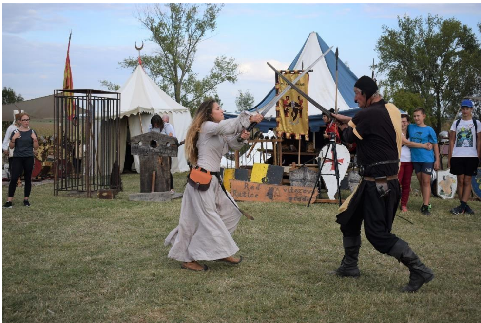
Povratak vitezova na utvrdu Kolođvar

Iako je manifestacija izostala u 2020. godini zbog nepovoljne epidemiološke situacije uzrokovane pojavom bolesti COVID-19, očekuje se da će se ista održati u 2021. godini, ukoliko prilike dopuste.