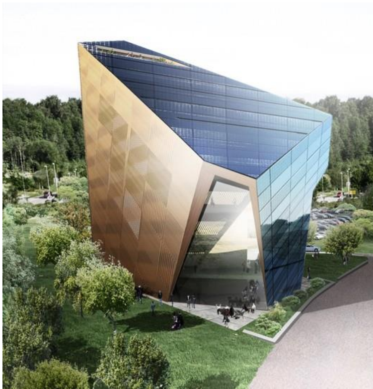
Prijedlog idejnog rješenja jedne od 2 zgrade RIC-a prema uzoru na prvu energetske pozitivnu zgradu u Norveškoj