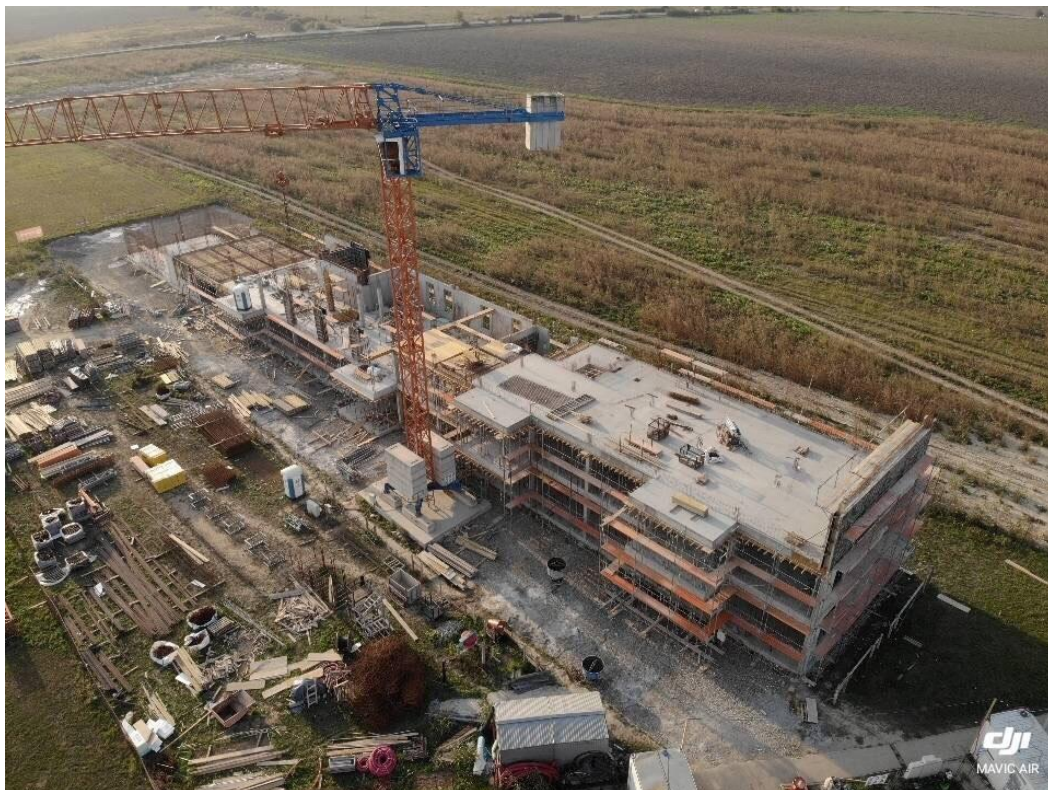
Poduzetnički inkubator i akcelerator Antunovac u izgradnji

Projekt će inicirati pokretanje novih poslovnih pothvata žena poduzetnica i mladih te razvoj vlastitih poslovnih ideja putem nove usluge softverskog rješenja „virtualnog asistenta“ i uvođenjem mogućnosti aditivnih tehnologija putem usluge 3D printera za inovativne proizvode.