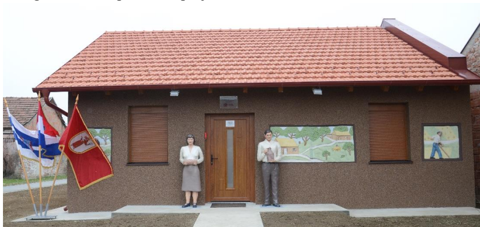
Kulturno-informativno turistički centar Žnidarec

U sklopu svoga redovnoga poslovanja, Agencija RODA d.o.o. provodi aktivnost vođenja Kulturno-informativno turističkog centra Žnidarec (KITC Žnidarec) u Ivanovcu koji je službeno otvoren u prosincu 2018. godine. Projekt rekonstrukcije i prenamjene postojeće kuće kipara naive Vjekoslava Žnidareca (1931.-2000.) u KITC Žnidarec sufinanciran je sredstvima Ministarstva turizma i Općine Antunovac, a njegovom realizacijom nastao je novi sadržaj vezan uz kulturno-povijesno nasljeđe ovoga kraja. Nositelj projekta vrijednog 731.762,04 kuna je Općina Antunovac, a projektnu prijavu za natječaj pripremila je Agencija za održivi razvoj Općine Antunovac – RODA d.o.o. za gospodarski i ruralni razvoj i poticanje poduzetništva, koja je bila angažirana i za provedbu projekta.